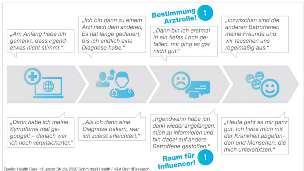
ABBILDUNG 1: PATIENT JOURNEY ZUM PASSENDEN INFLUENCER

Zum Zeitpunkt einer Erstdiagnose zeigt sich ein intensives Suchverhalten im Internet