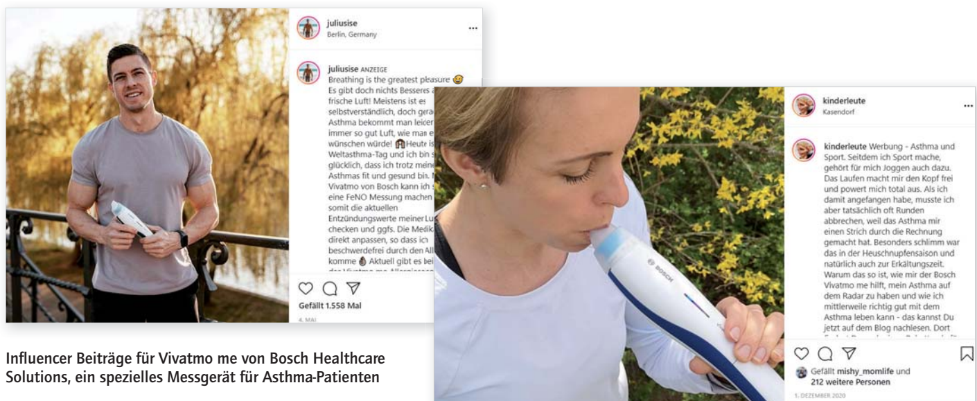
Influencer Beiträge für Vivatmo me von Bosch Healthcare Solutions, ein spezielles Messgerät für Asthma-Patienten