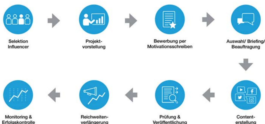
ABBILDUNG 5: WORKFLOW INFLUENCER-MARKETING-KAMPAGNEN

Influencer Marketing hilft dabei, messbar und zielorientiert Marketingziele umzusetzen und gleichzeitig der Zielgruppe einen echten Mehrwert zu bieten